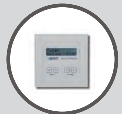
DIWAC Digitaler Wand-Controller