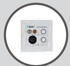
ALINP Wand-Controller mit lokalen Eingängen